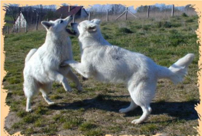
Adonis hilft Lady beim Welpenunpassigen Spiel mit Sohn Adonis!