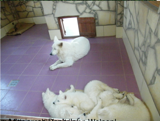
ylzwdscbrn - Mittrissnblfamttrifden Welpenl